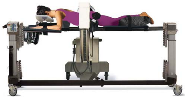
頸椎を安定させた状態での腰椎手術