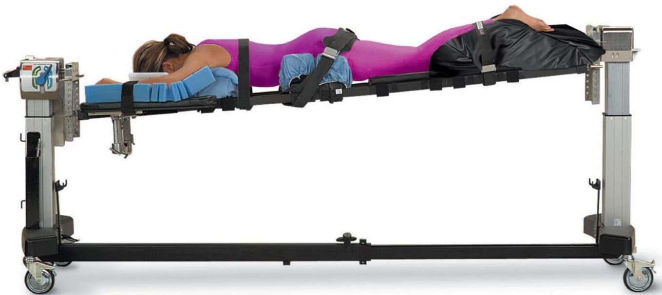
抜群のCアームのアクセス