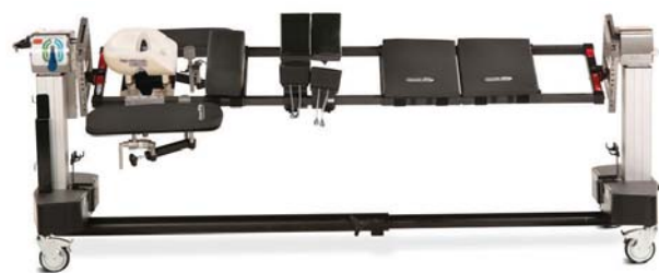
アドバンスドコントロール・パッドシステム™を装着した スパイナルテーブルトップ