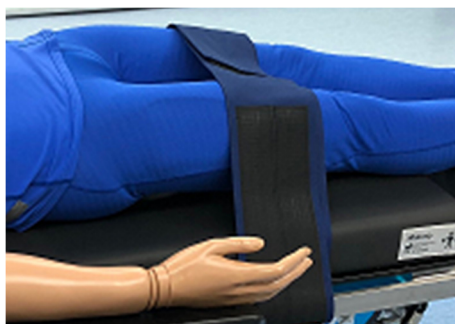
タリスマンバンド A1 使用例