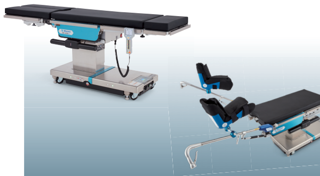
MOT-VS700 + レビテーターⅡ

汎用手術台の最高機種であるVS700を展示。リニューアルしたレビテーターⅡや、新アクセサリと合わせて展示いたします。