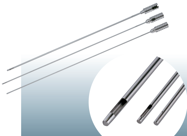
ウイルス治療用インジェクションプローブ

汎用手術台の最高機種であるVS700を展示。リニューアルしたレビテーターⅡや、新アクセサリと合わせて展示いたします。