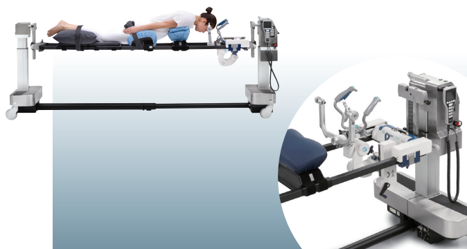
Trios テーブル + Levo ヘッドポジショニングシステム

東京大学で世界初の脳腫瘍ウイルス療法が承認されました。悪性神経膠腫の治療を目的として承認された「がん治療用ウイルス」を、専用のプローブでターゲット部位に注入するための器具をミズホが製造。今までにない新分野の製品をご紹介します。